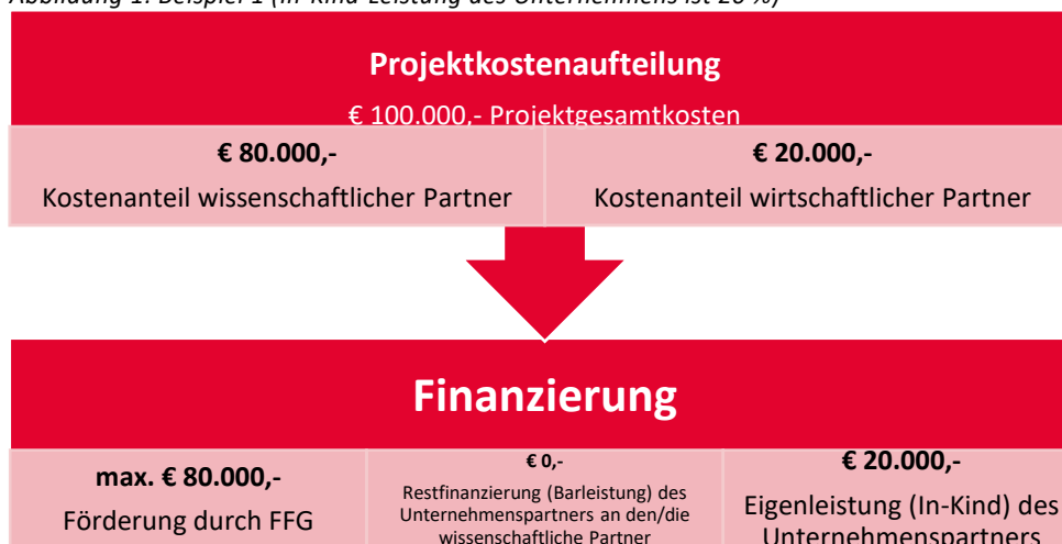
Abbildung 1: Beispiel 1 (In-Kind-Leistung des Unternehmens ist 20 %)

Wenn bei Gesamtkosten von € 100.000,- die wissenschaftlichen Partner € 80.000,- Kosten haben und die Verwertungspartner € 20.000,-, so beträgt die Förderung durch die FFG bei ausschließlicher Beteiligung von Kleinen Unternehmen max. € 80.000,-. Für die eigenen Personal- und Sachleistung erhalten die Unternehmen keine Förderung (siehe Abbildung 1).